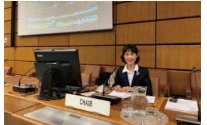
議長席に座る受賞者

受賞者は、2021年に行われた国連宇宙空間平和利用委員会(COPUOS)法律小委員会において、日本人として初めて議長を務め、①宇宙資源の探査・開発・利用、②宇宙法に関する能力開発、③デブリ問題、④宇宙交通管理、⑤小型衛星活動への国際法の適用などの論点を取りまとめ、本小委員会を成功に導いた。本件は、宇宙空間における法の支配の実現に資する実効的なルール作りに対する日本の人的貢献の一環として、日本政府のみならず諸外国から高く評価された。