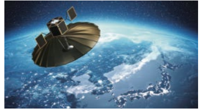
QPS研究所小型SAR衛星フライトモデルイメージ図

受賞者は、展開アンテナによる小型SAR衛星を開発し、2021年5月に70cm分解能という100kg級小型SAR衛星として日本で最も精細なSAR画像の取得に成功した。衛星コンステレーション(36機)によるサービス化により、防災情報の提供など今後の活動が大きく期待される。先行する海外勢を巻き返し、超小型SAR衛星コンステレーションの領域で日本が世界をリードする意味でも重要な取り組みである。