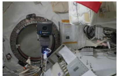
国際宇宙ステーション内の宇宙アバター

受賞者は、本実証で一般の方が街中から国際宇宙ステーション(ISS)日本実験棟「きぼう」に設置された宇宙アバター[space avatar]にインターネットで接続し、リアルタイムで直接動かし「きぼう」船内から宇宙や地球を眺めることを可能とした。宇宙アバターの技術活用に向けた宇宙-地上間のアバター技術実証に加え、物理的に宇宙空間へ行くことが難しい一般の方が遠隔操作をリアルタイムで気軽に体験し楽しめる貴重な空間を世界で初めて実現したことインパクトがある。