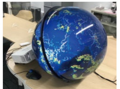
Today's Earth全球版(TE-Global)のデジタル地球儀「SPHERE」

受賞者は、JAXAの衛星データ・解析技術と東大のシミュレーション技術を融合し、陸上の水循環を即時に推定するシミュレーションシステム「Today's Earth」を開発・運用し、防災にも利用可能な精度での洪水予測を可能にした。衛星コンステレーション時代の到来を念頭に、複数の衛星から得られる観測データと陸域シミュレーションとを組み合わせる技術は今後ますます重要になると考えられ、本事例はその先駆けとなることが期待される。