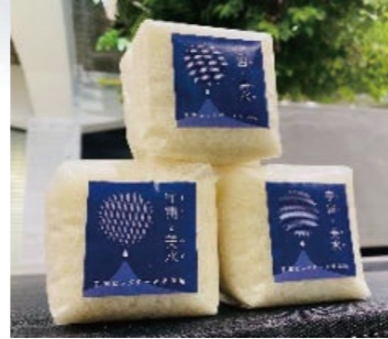
宇宙ビッグデータ米

受賞者は宇宙ビッグデータを活用し、栽培場所と栽培品種の最適なマッチングと、衛星データとIoT水門を連携させた自動水温管理による米の生産に成功した。またその米をブランド化し広く販売した。衛星データの活用を農業生産のみならず、「宇宙ビッグデータ米」と命名して販売にまでつなげた新たな取組であり、宇宙関連技術の社会的な認知度の向上にも貢献している。