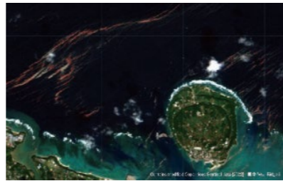
軽石部分をAIが赤く表示

受賞者は、専門家に依存しない衛星解析AIプラットフォーム「GRASP EARTH」で、光学やSARなど様々な衛星画像を「全地球対象」かつ「複数の撮影時間」で自動的に取得し、広域を時系列で比較し、変化の発見を可能とした。WEB上の簡単なUIで、衛星解析の知識が無いユーザーでも使用でき、公開後1000名超が利用している。光学やSARの衛星画像を専門家に依存しない形で解析できるようにしている点は、今後の宇宙データ利用に大きく寄与でき、環境問題・災害対策等の行政に幅広く使用可能であることが期待される。